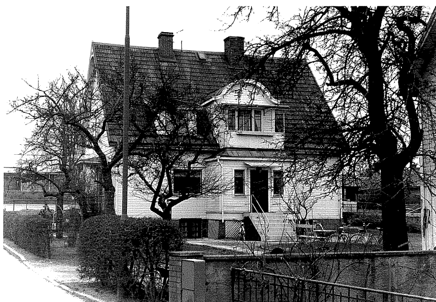
Bostadshus a fr.NO, 3:31.