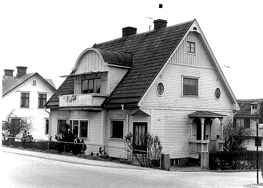
Bostadshus a fr.60, 3:30.