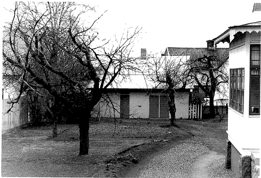
Uthus b fr.S, 3:34.