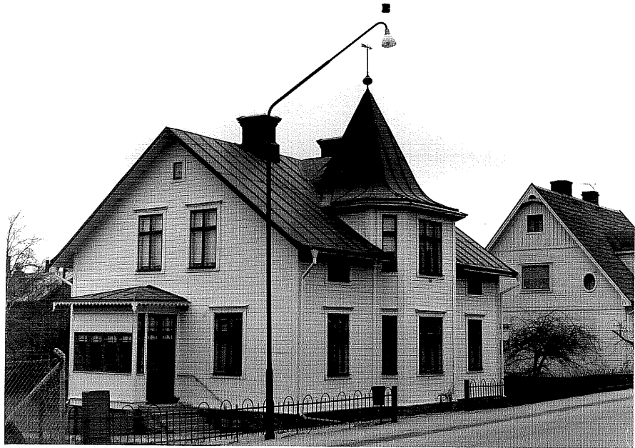
Bostadshus a fr.SV, 3:33.

Ödeshög sn Ödeshög Gästgivargård 4 12 Kungsvägen foto:M.Wikdahl,1978.