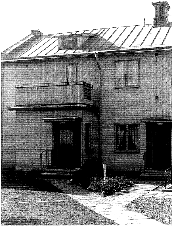
Bostadshus a fr.60, 3:25

Ödeshög sn Ödeshög Gästgivargård 4 13 Kvarngatan foto:M.Wikdahl,1978