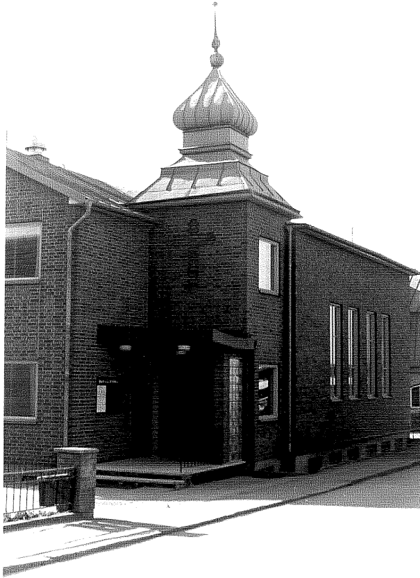
Baptistkyrkan fr.60, 3:24

Ödeshög sn Ödeshög Gästgivargård 4 13 Kvarngatan foto:M.Wikdahl,1978