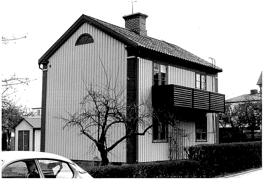
Bostadshus a fr.NV, 16:24.

Ödeshög sn Ödeshög Gästgivargård 4 18 Kvarngatan 4 foto:M.Wikdahl,1978.