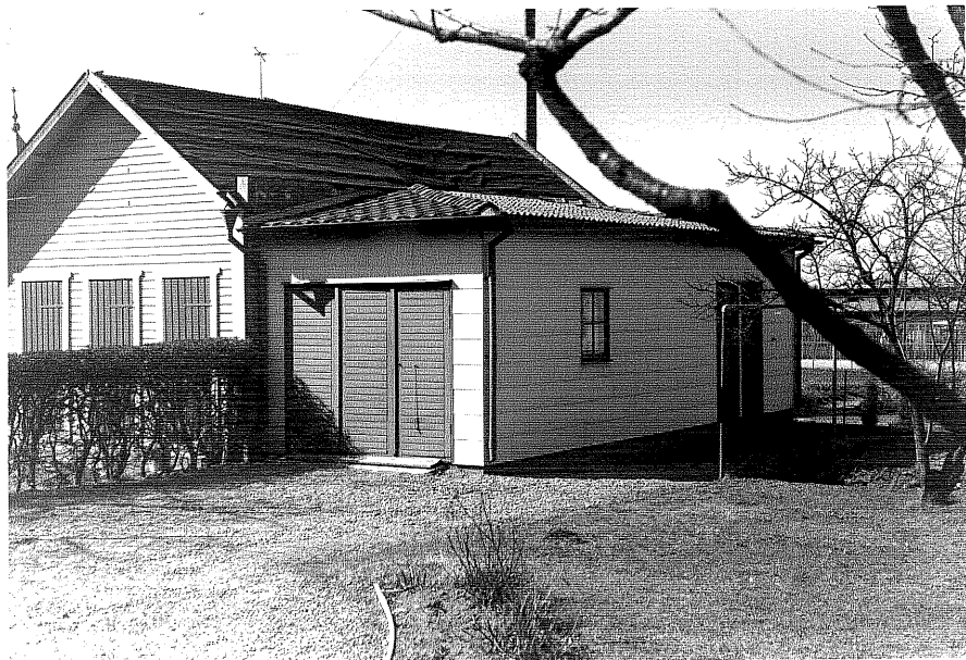
Uthus b fr.60, 3:9.