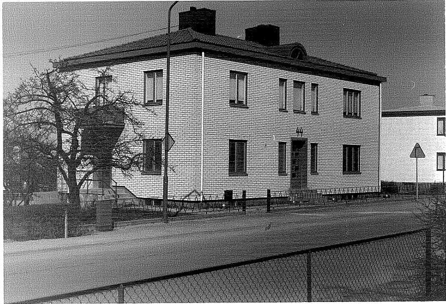
Bostadshus a fr.SV, 3:8.

Ödeshög sn Ödeshög Gästgivargård 4 23 Kungsvägen 44 foto:M.Wikdahl,1978.