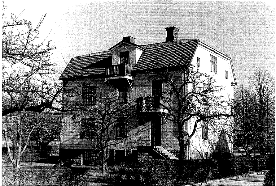
Bostadshus a fr.NV, 3:29.