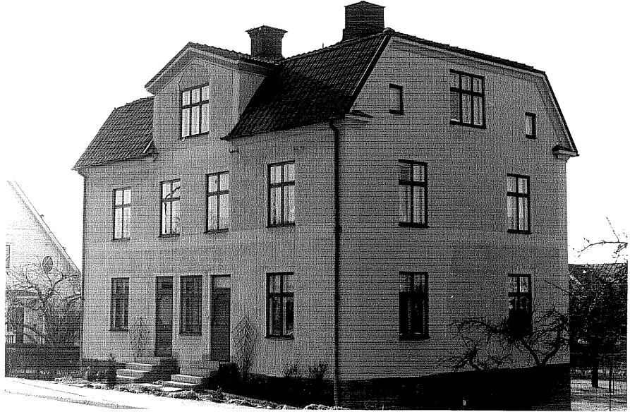
Bostadshus a fr.80, 3:28.

Ödeshög sn Ödeshög Gästgivargård 4 24 Kvarngatan 2 foto:M.Wikdahl,1978.