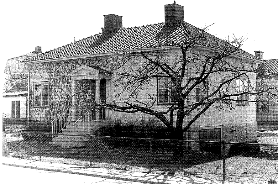
Bostadshus a fr.NO, 3:10.