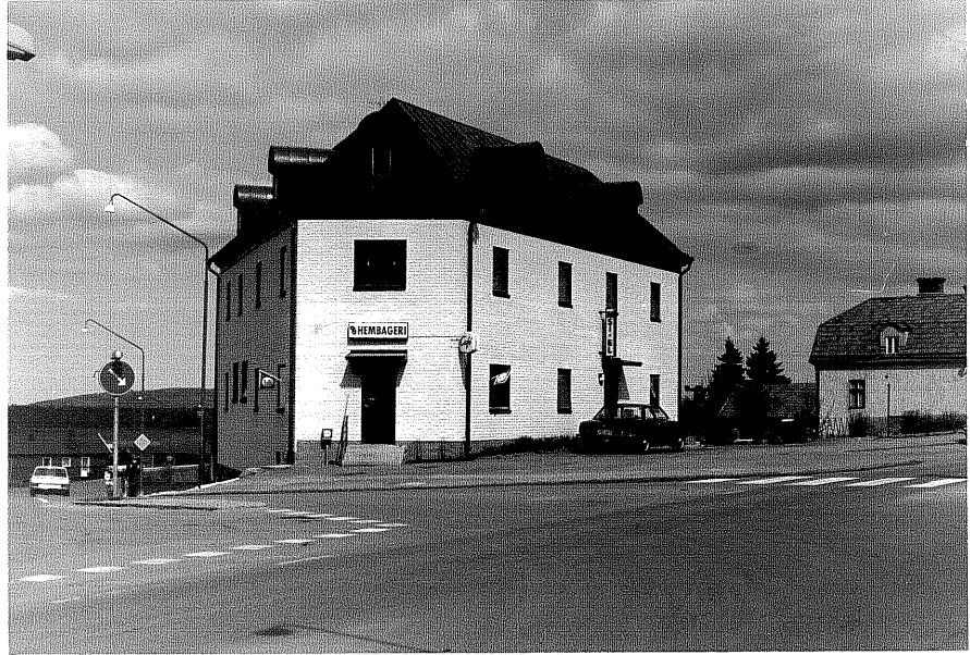
Affärs och bostadshus fr.S, 7:35.

Ödeshög sn Ödeshög Klockargård 3 13 Storgatan foto:M.Wikdahl,1978.