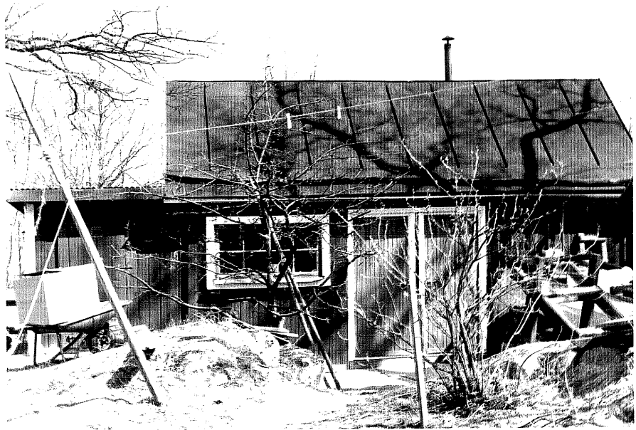
Uthus b fr.S, 10:10.

Ödeshög sn Ödeshög Klockargård 3 28 Brodderydsvägen 1978.