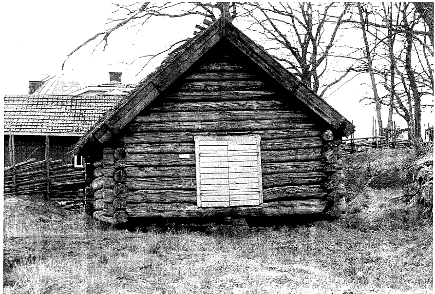
Lada d fr.N, 14:28.