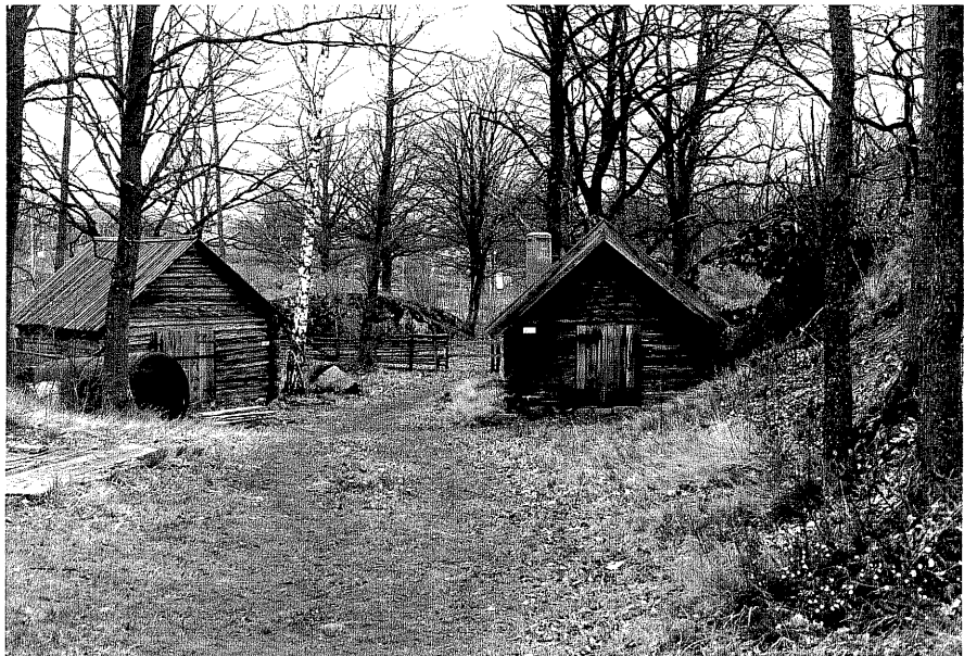
Smedja i och lada j fr.6, 14:25.