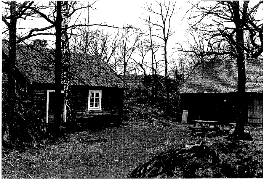
Heddastuan g och Knektagården h fr.60, 14:26.

Ödeshög sn Ödeshög Klockargård 3 30 Hembygdsgården. foto:M.Wikdahl,1978.