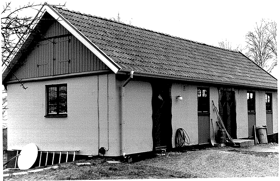
Uthus b fr.NO, 9:33.

Ödeshög sn Ödeshög Klockargård 3 4 Mjölbyvägen 18. foto:M.Wikdahl, 1978.