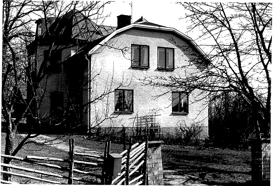
Bostadshus a fr. SV, 10:8.

Ödeshög sn Ödeshög Klockargård 3 41 Brodderydsvägen