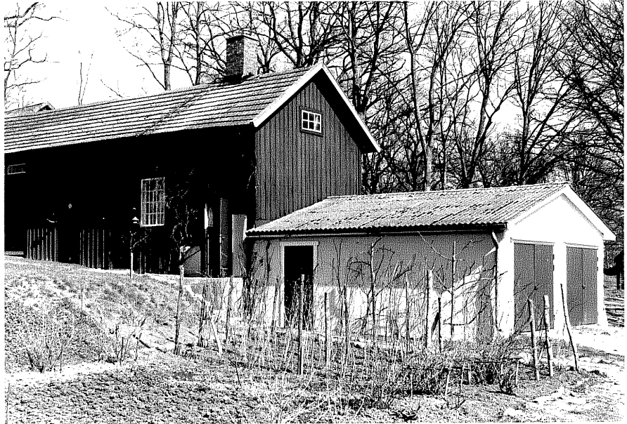
Uthus b fr.60, 10:7.

Ödeshög sn Ödeshög Klockargård 3 41 Brodderydsvägen 1978.