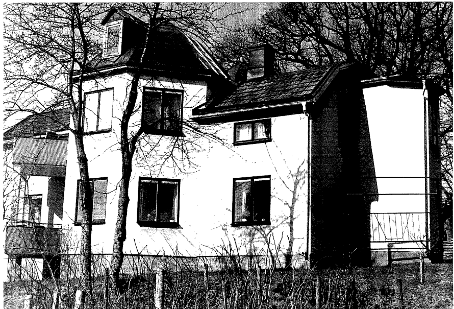
Bostadshus a f .NO, 10:6.