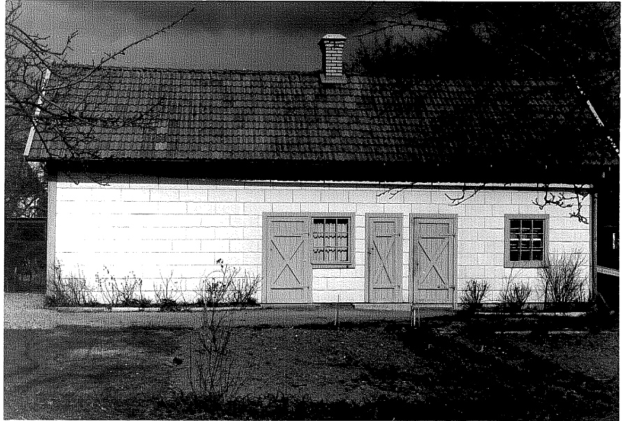
Uthus b fr.V, 9:23.

Ödeshög sn Ödeshög Klockargård 3 43 Mjölbyvägen 12. foto:M.Wikdahl,1978.