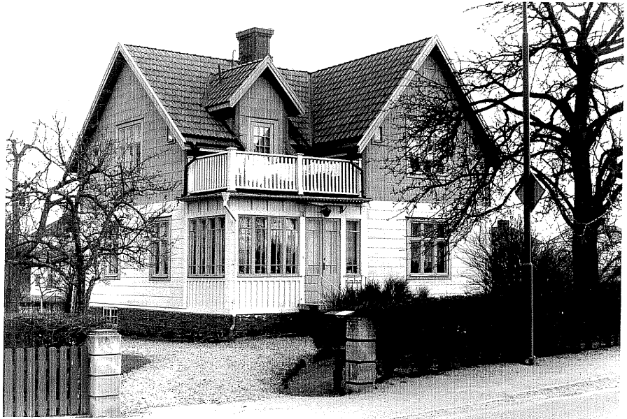
Bostadshus a fr.N, 9:25.

Ödeshög sn Ödeshög Klockargård 3 43 Mjölbyvägen 12 foto:M.Wikdahl,1978.