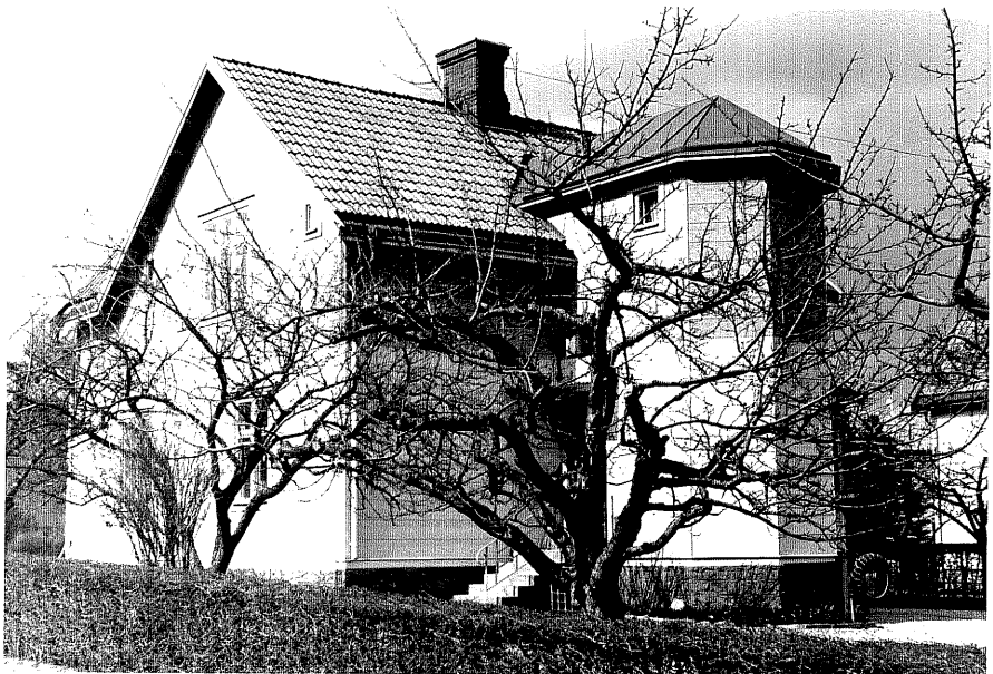
Bostadshus a fr.SV, 9:24.