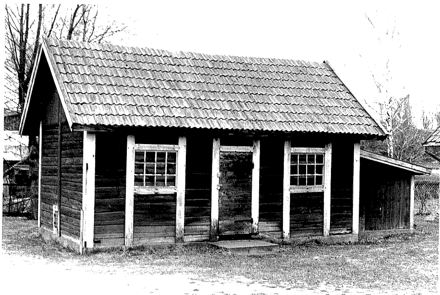
Uthus b fr.N, 9:28.