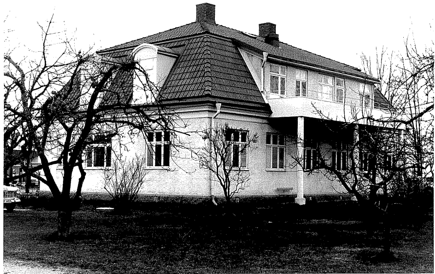
Kommunkontoret fr.S, 9:30.