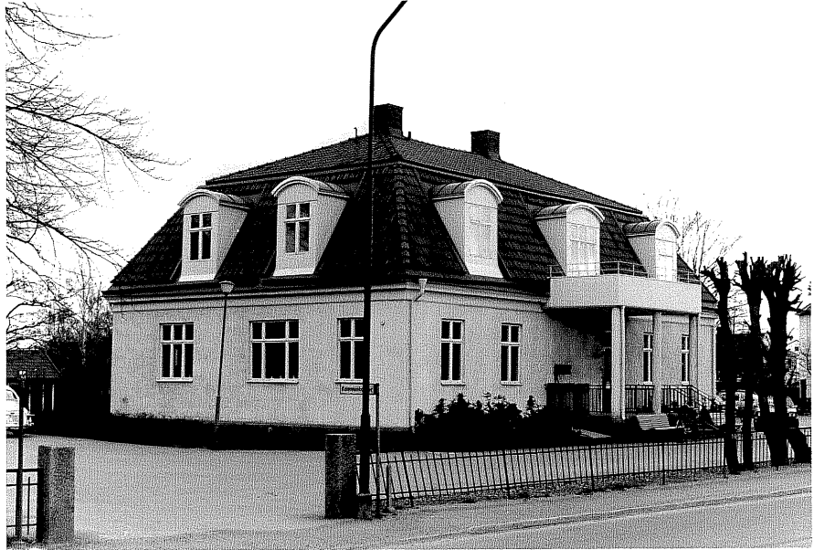
Kommunkontoret fr.N, 9:29.

Ödeshög sn Ödeshög Klockargård 3 6 Mjölbyvägen 16 foto:M.Wikdahl,1978.