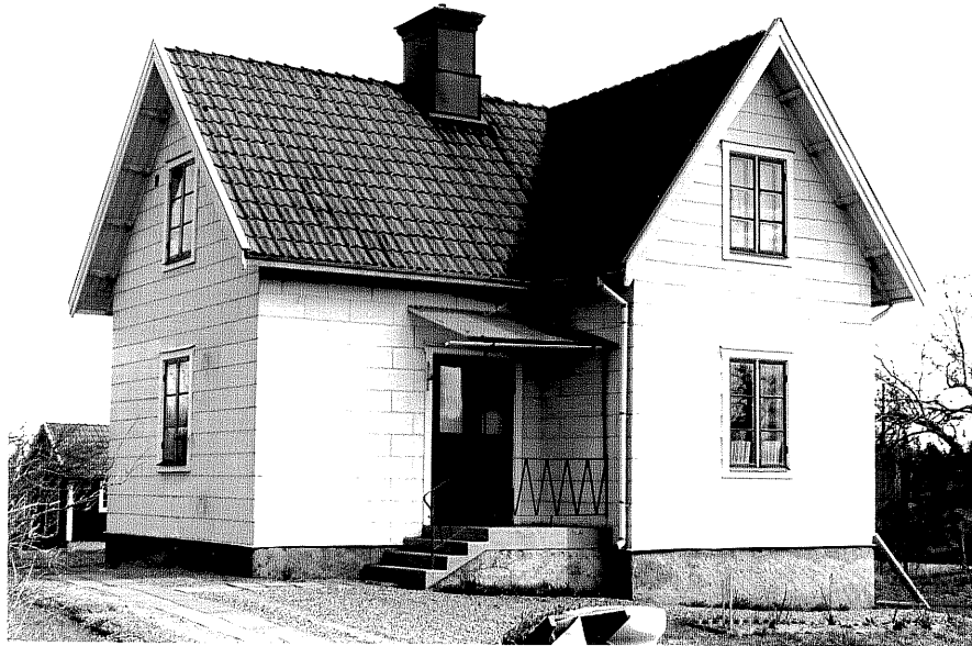
Bostadshus a fr.6V. 10:15.