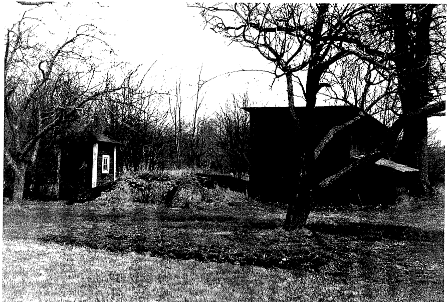
Uthus d och e fr.S, 10:13.