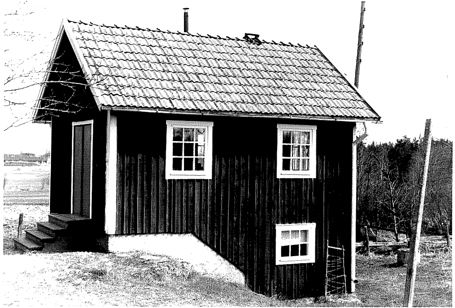
Uthus c fr.SV, 10:12.

Ödeshög sn Ödeshög Klockargård 3 9 Brodderydsvägen foto:M.Wikdahl,1978.