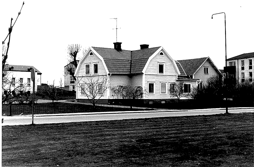
Bostadshus a fr.S, 17:18.

Ödeshög sn Ödeshög Klockaregård 3 1 Tingshusgatan foto:M.Wikdahl,1978.