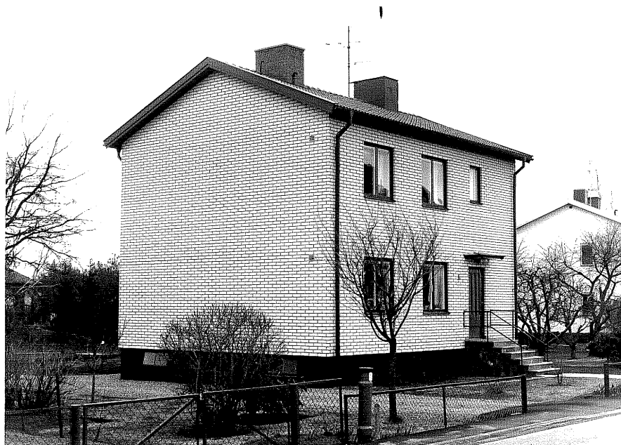
Bostadshus fr.N, 9:8.