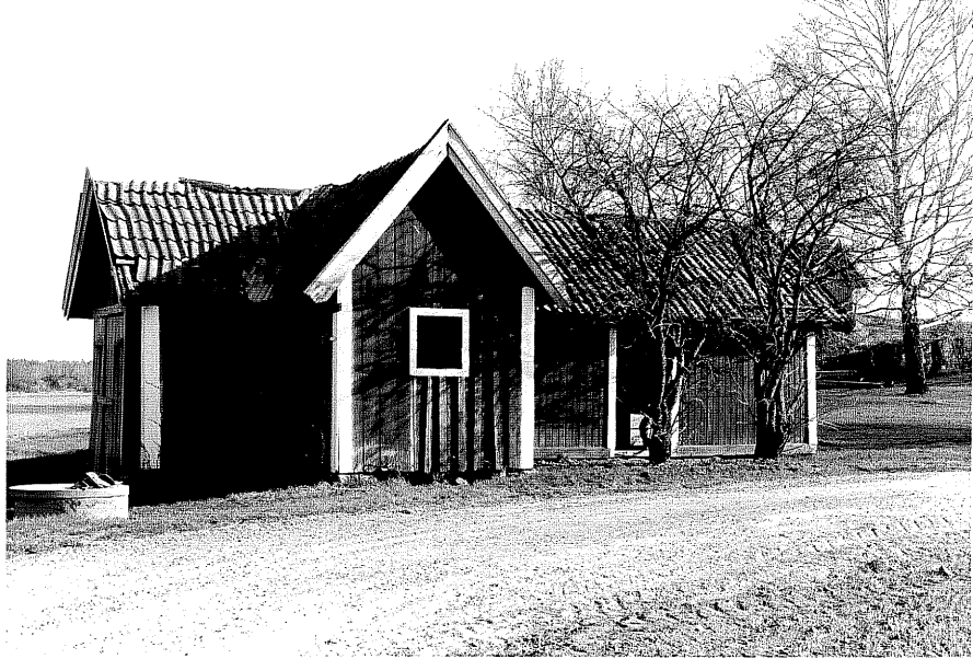
Uthus e fr.N, 14:14.

Ödeshög sn Ödeshög Pilgård 19 1 Grännavägen foto:M.Wikdahl,1978.