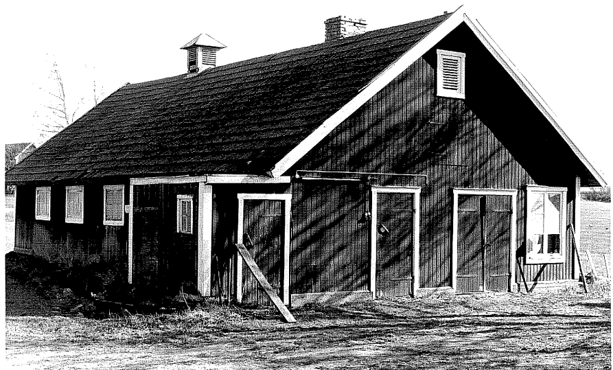
Uthus d fr.N, 14:15.