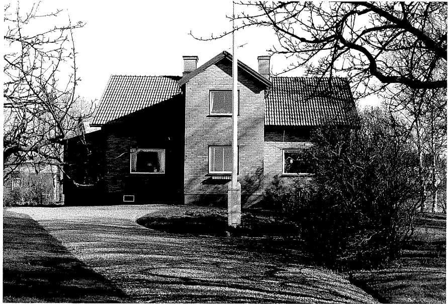
Bostadshus a fr.N, 14:17.

Ödeshög sn Ödeshög Pilgård 9 1 Grännavägen foto:M.Wikdahl,1978.