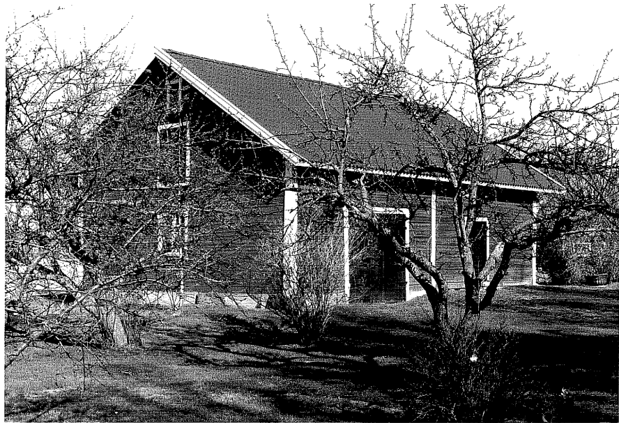
Uthus b fr.NV, 14:18.