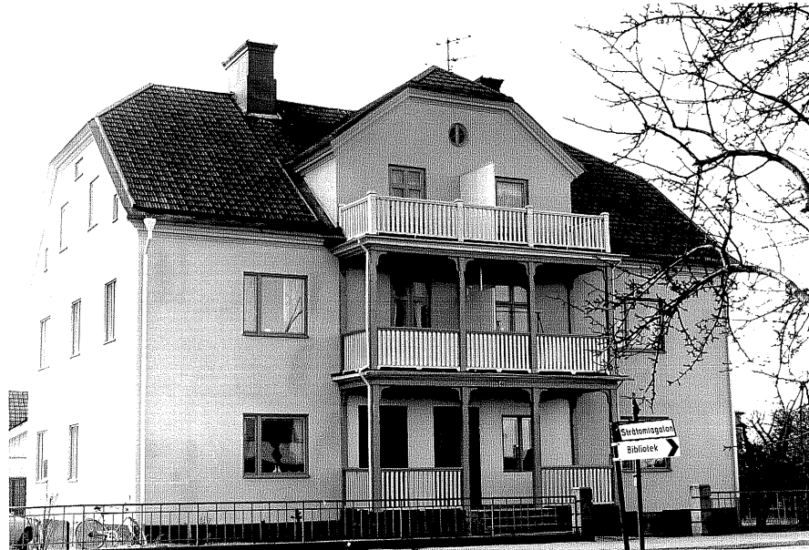
Bostadshus a fr.N, 11:15.