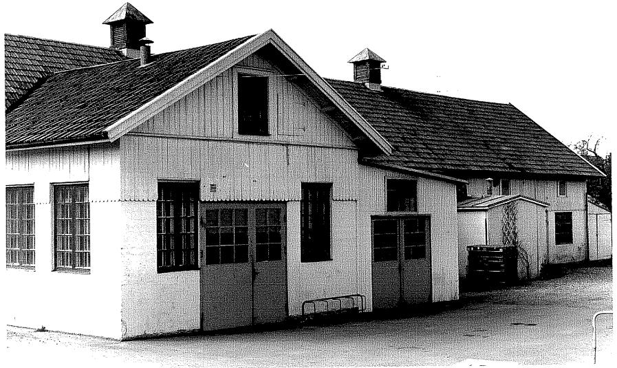
Verkstad b fr.NV, 11:14.

Ödeshög sn Ödeshög Riddargård 1 86 Storgatan 41