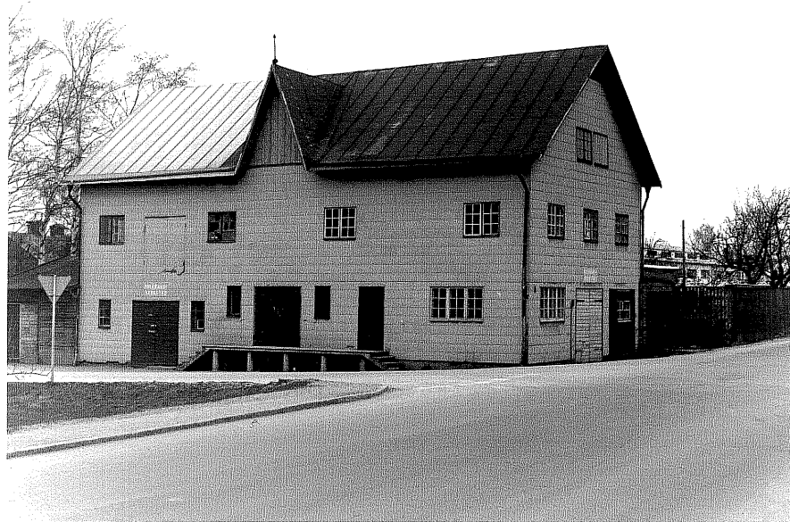
Fabrikslokal fr.SV, 4:2.