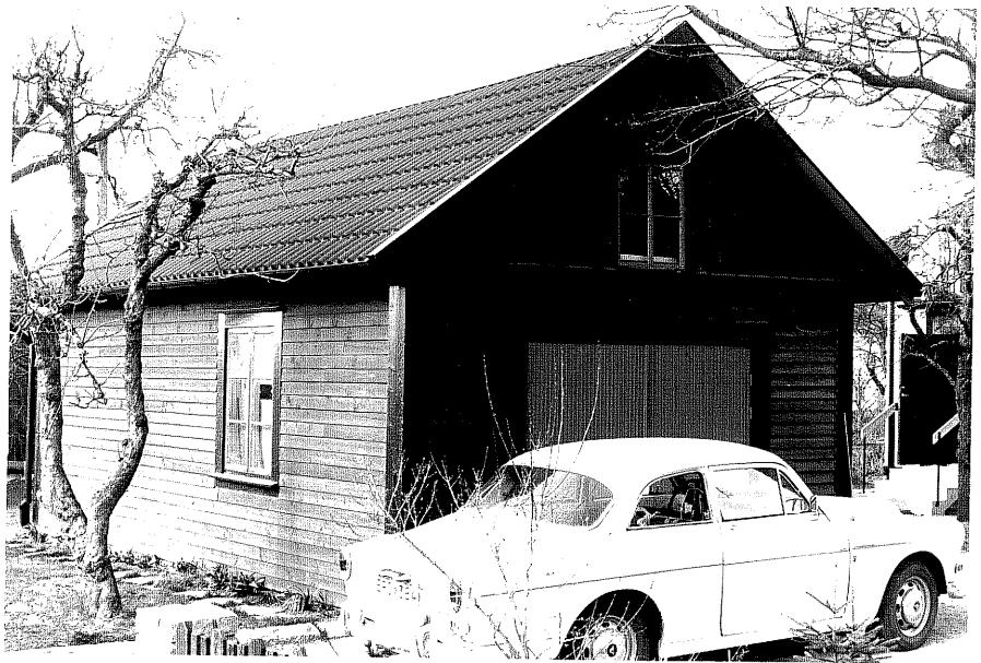
Garage b fr.SV, 11:10.