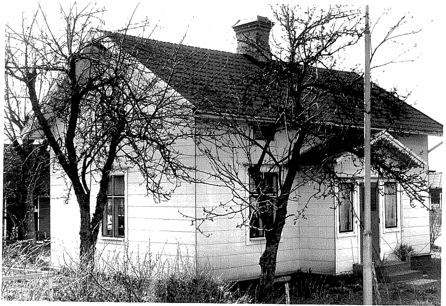
Bostadhus a fr.60, 11:12.

Ödeshögs sn Ödeshög Riddargård 1 35 Trädgårdsgatan 2 foto:M.Wikdahl,1978.