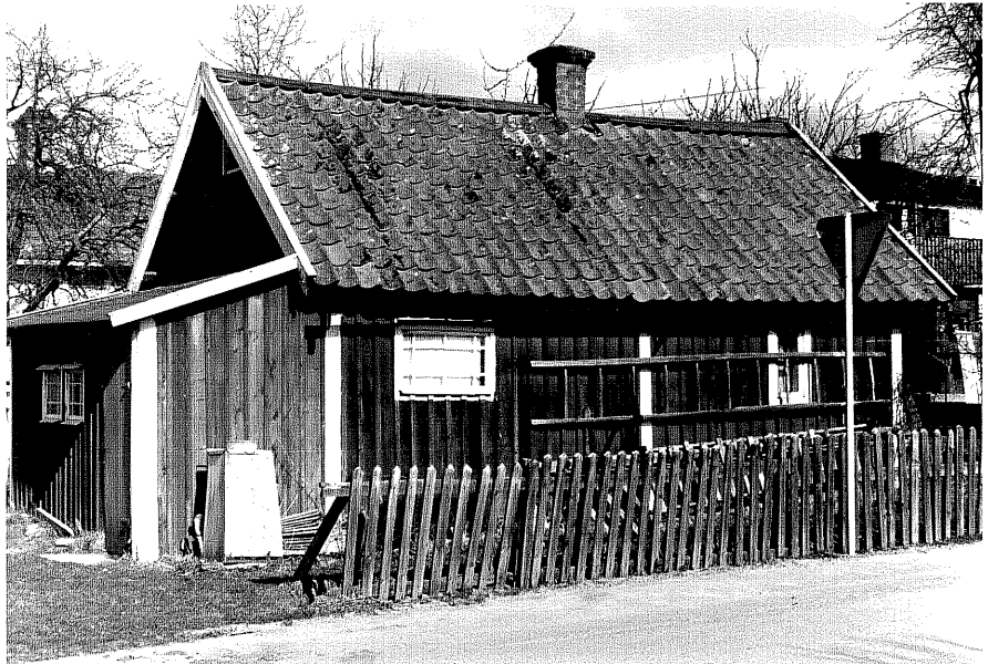
Uthus b fr.V, 11:11.