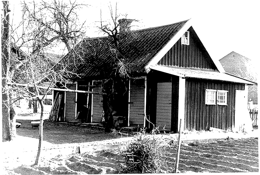
Uthus b fr.N, 11:13.

Ödeshög 33 Ödeshög Riddargård 1 35 Trädgårdsgatan 2 foto: M. Wikdahl, 1978.