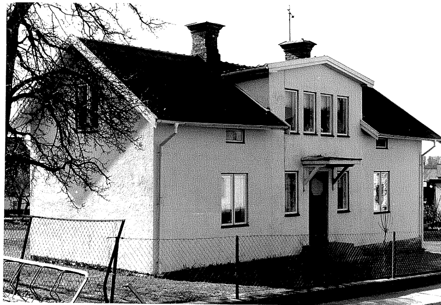
Bostadshus a fr.0, 11:1.