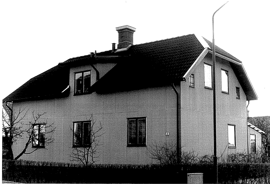
Bostadshus a fr.N, 10:32.