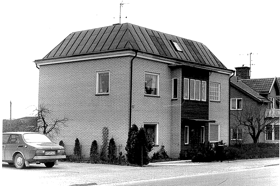
Bostadshus a fr.NO, 5:1.

Ödeshög sn Ödeshög Riddargård 1 47 Storgatan 371978.