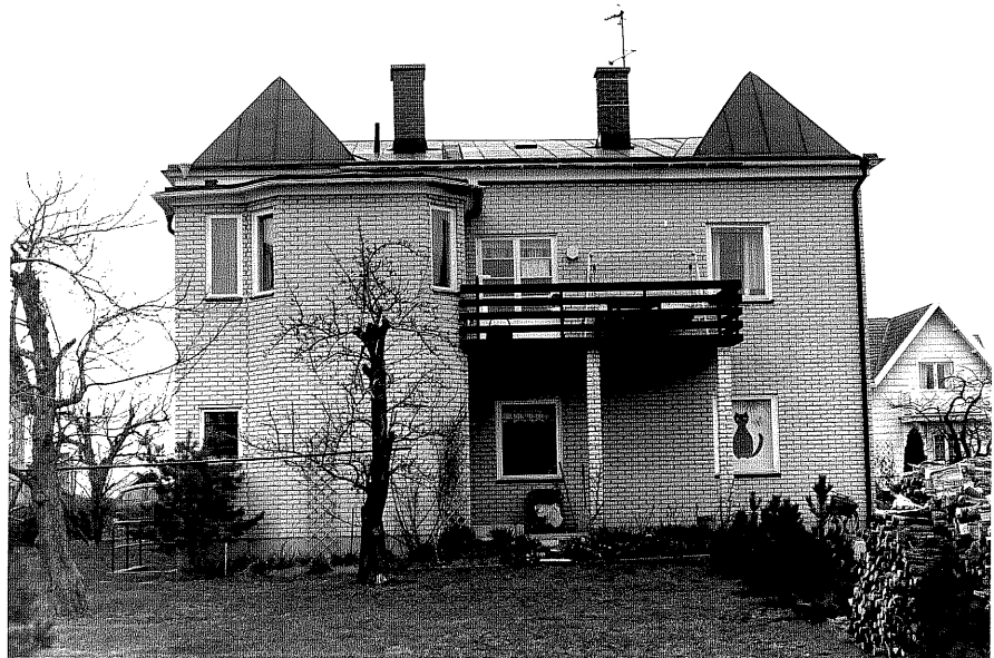
Bostadshus a fr.S, 4:37.