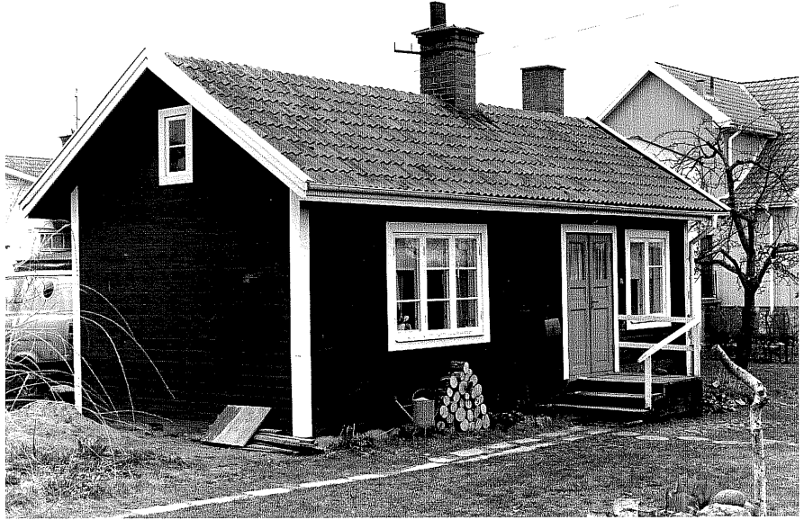
Bostadshus b fr.NV, 4:34.

Ödeshög sn Ödeshög Riddargård 1 65 Storgatan 37 foto:M.Wikdahl,1978.