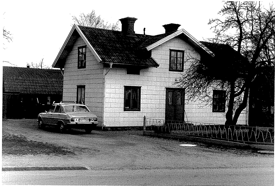
Bostadshus a fr.SV, 6:27.