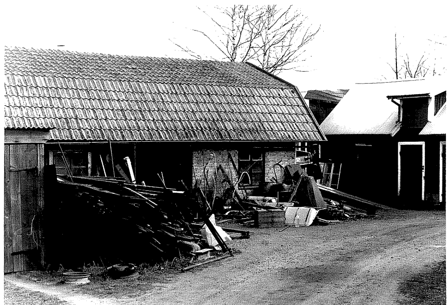
Smedja b fr.V, 6:26.