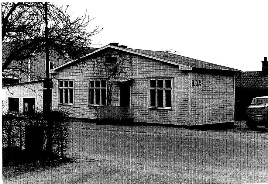
Glasmästeriverkstad a fr.O, 4:32.

Ödeshög sn Ödeshög Riddargård 1 69 Tranåsvägen foto:M.Wikdahl,1978.