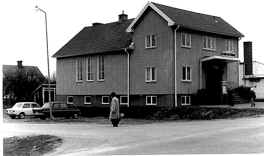
Filadelfiakyrkan a fr.50, 4:31.