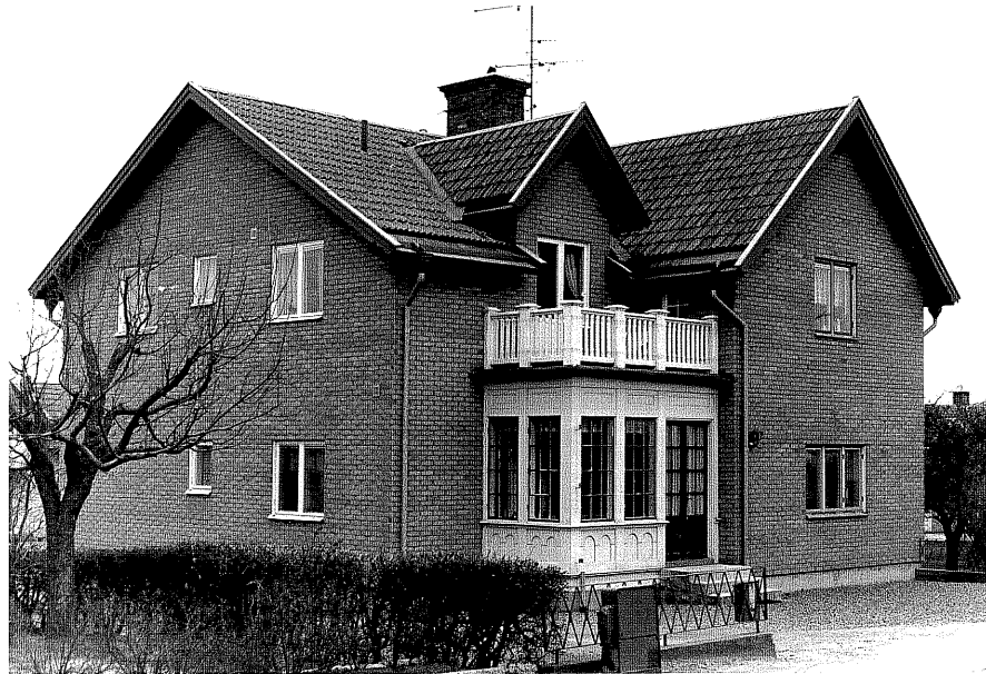
Bostadshus a fr.NO, 4:28.