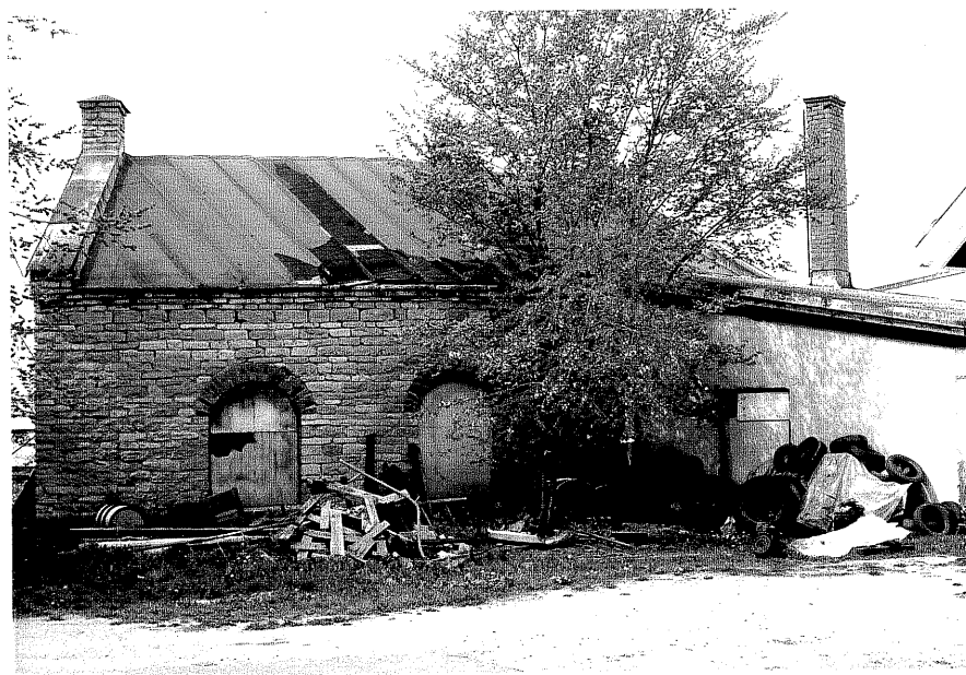
Lokstallet fr.O, 18:2.