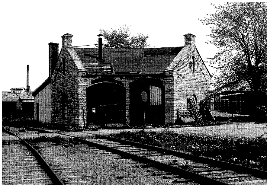
Lokstallet fr.V, 18:1.

Ödeshög sn Ödeshög Riddargård 176 1978.