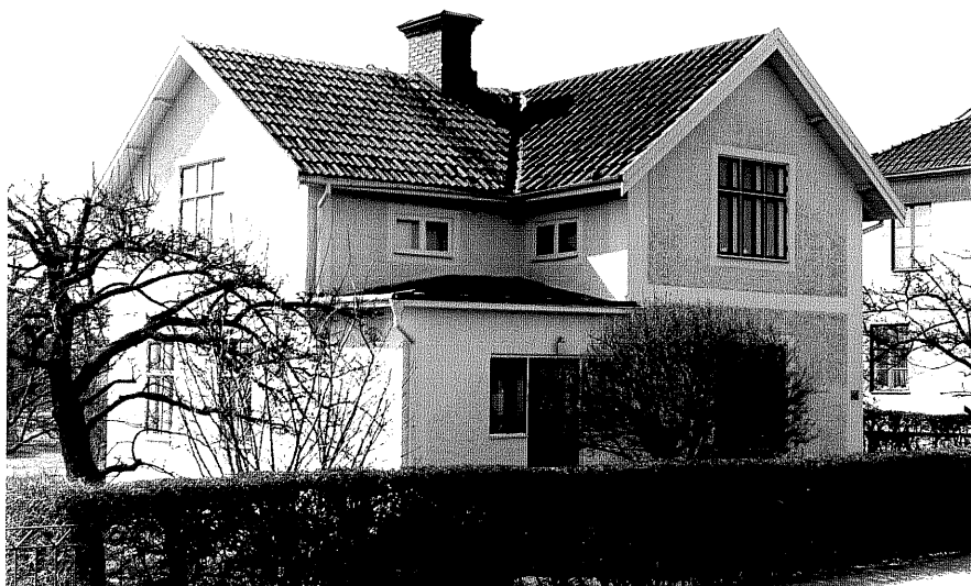
Bostadshus a fr.NO, 11:23.

Ödeshög sn Ödeshög Riddargård 1 80 +1 102 Storgatan 45 foto:M.Wikdahl,1978.