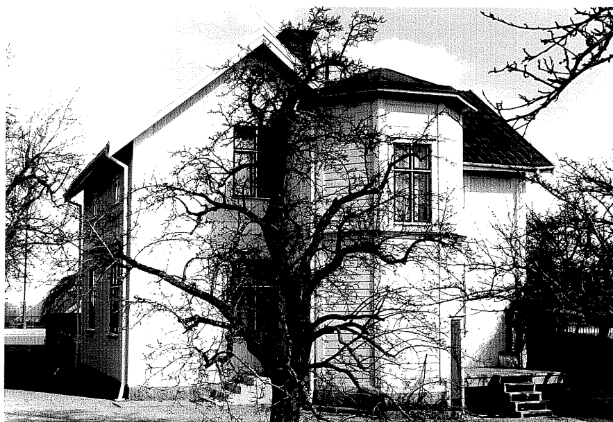
Bostadshus a fr.S, 11:22.