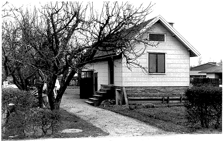
Uthus b fr.V, 4:30.