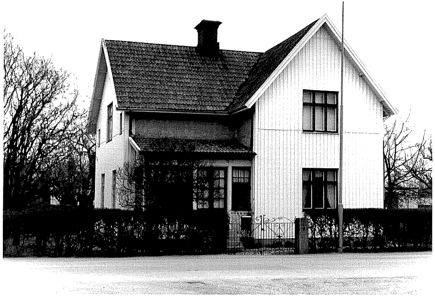
Bostadshus a fr.V, 4:29.

Ödeshög sn Ödeshög Riddargård 1 82 Järnvägsgatan 11 foto:M.Wikdahl,1978.