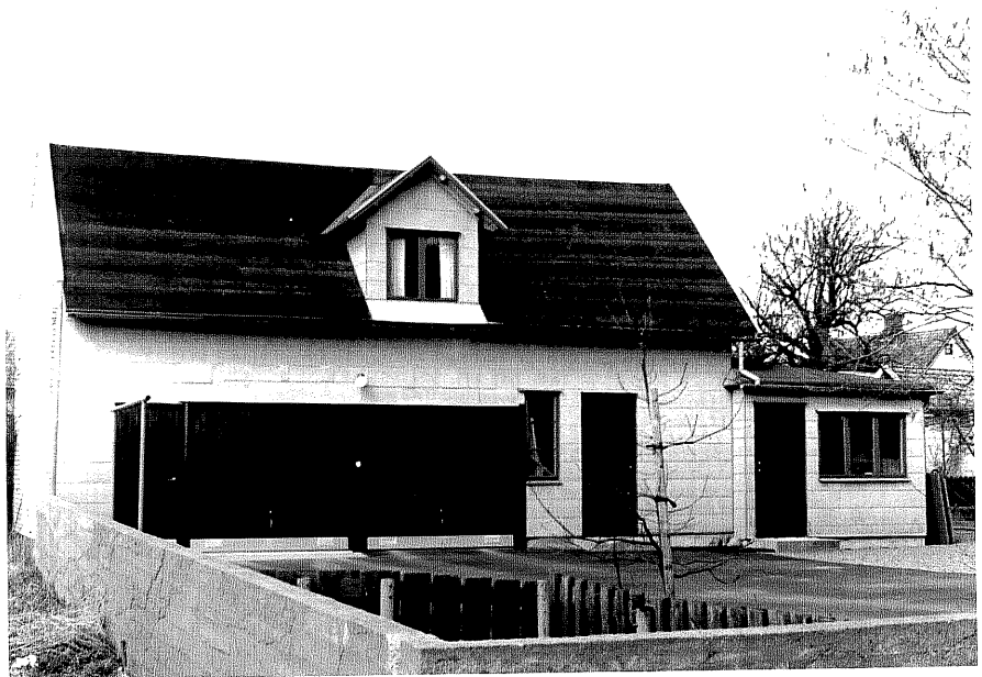
Uthus b fr.O, 11:19.