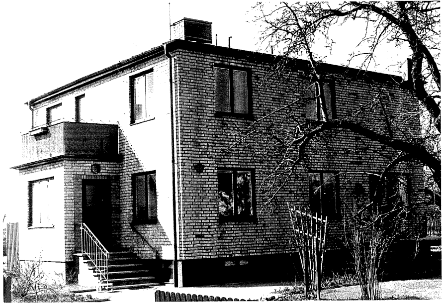
Bostadshus a fr.N, 11:20.

Ödeshög sn Ödeshög Riddargård 1 83 +1 84 Storgatan 43. foto:M.Wikdahl,1978.