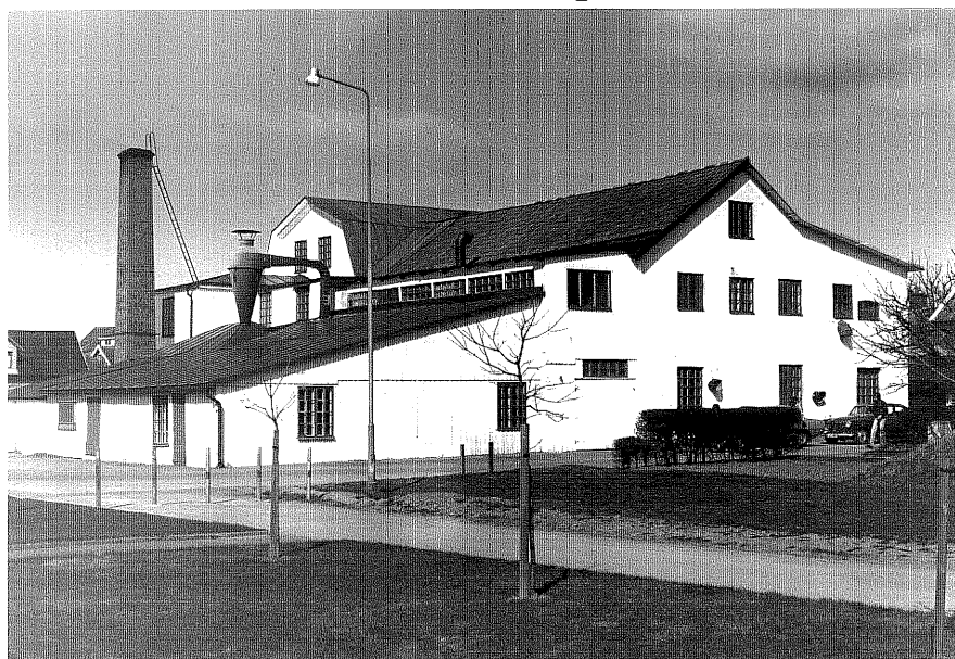
Fabriksbyggnad fr.S0, 11:18.

Ödeshög sn Ödeshög Riddargård 1 85 Stråtomtagatan. foto:M.Wikdahl,1978.