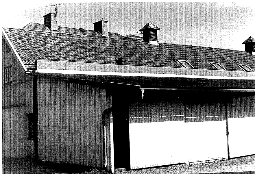
Lagerlokal b fr.SV, 11:17.