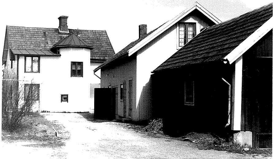
Bostadshus a,uthus b och c fr.S, 11:32.