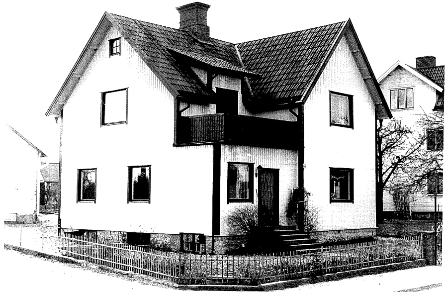
Bostadshus a fr.NO, 11:33.

Ödeshög sn Ödeshög Riddargård 1 95 Storgatan 49 foto:M.Wikdahl,1978