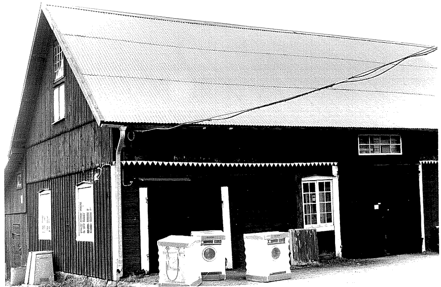
Ladugård g fr.NO, 11:30.

Ödeshög sn Ödeshög Riddargård 1 95 Storgatan 49 foto:M.Wikdahl,1978.