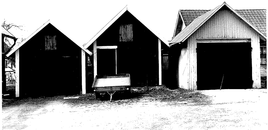
Garage d,e och f fr.O, 11:31.