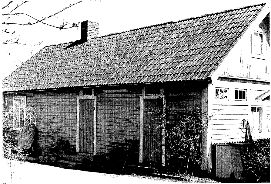
Uthus b fr.SV, 11:34.

Ödeshög sn Ödeshög Riddargård 1 97 Storgatan 51 1978.