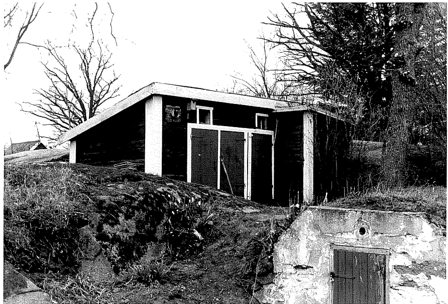
Uthus c fr.NO, 14:31.