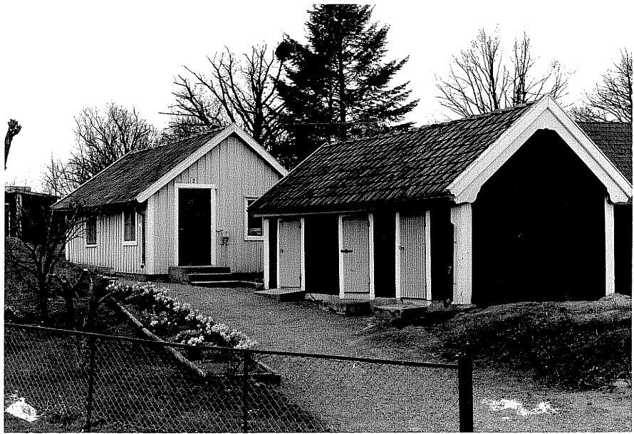
Bostadshus a och Uthus b fr.N, 14:32.

Ödeshög sn Ödeshög Skattegård 2 2 Morlidsvägen 2 foto:M.Wikdahl,1978.