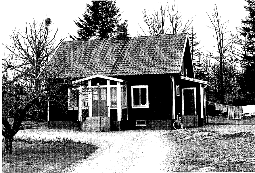
Bostadshus a fr.NO, 14:34.

Ödeshög sn Ödeshög Skattegård 2 2 Arrendatorsbostället Smedjegatan 34. 1978.