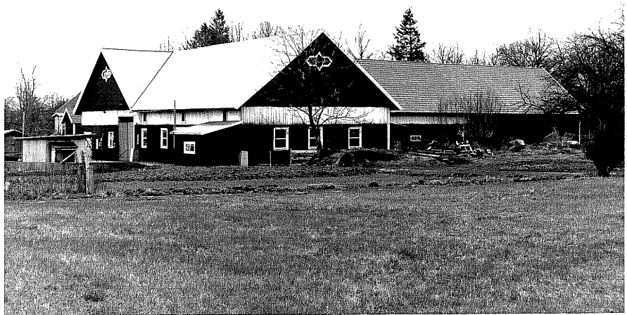
Ladugård b fr.NV, 15:2.