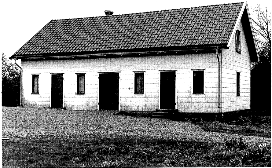
Uthus c fr.N, 14:36.

Ödeshög sn Ödeshög Skattegård 2 2 foto:M.Wikdahl,1978