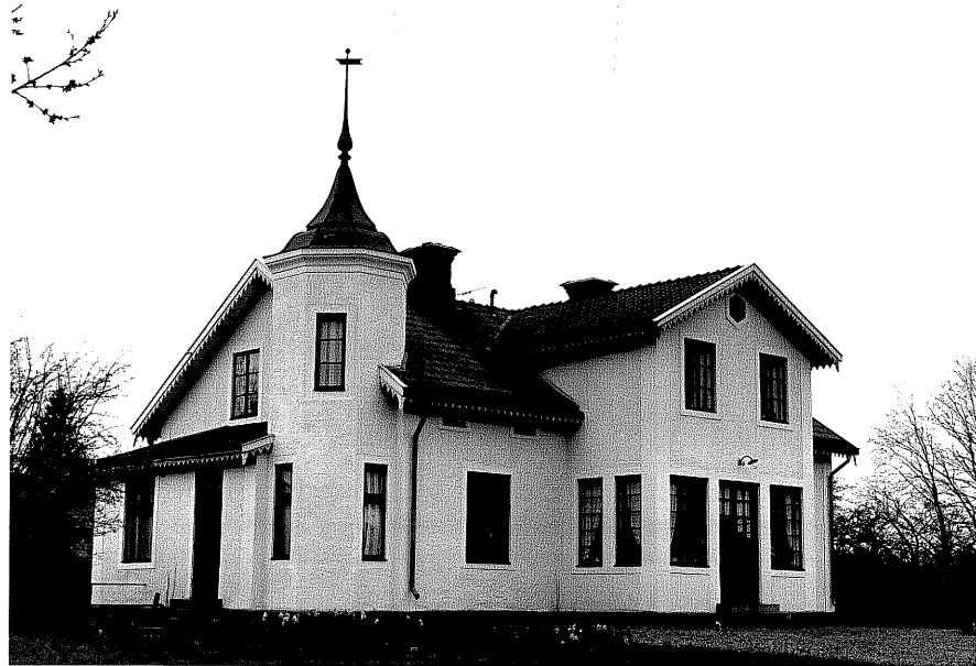
Bostadshus a fr.N, 15:1