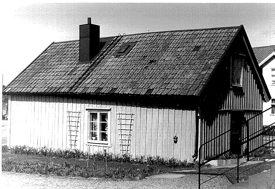
Bostadshus a fr.S, 6:31.