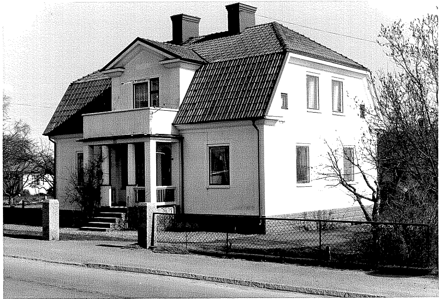
Bostadshus a fr.NV, 12;19.

Ödeshög sn Ödeshög Skattegård 2 27 Grännavägen 1 foto:M.Wikdahl,1978.