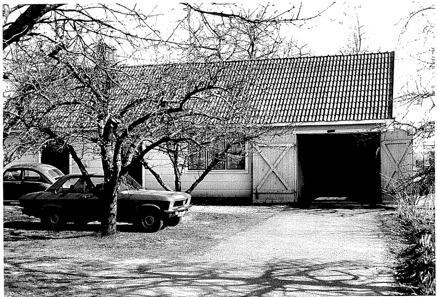
Uthus b fr.N, 12:18.