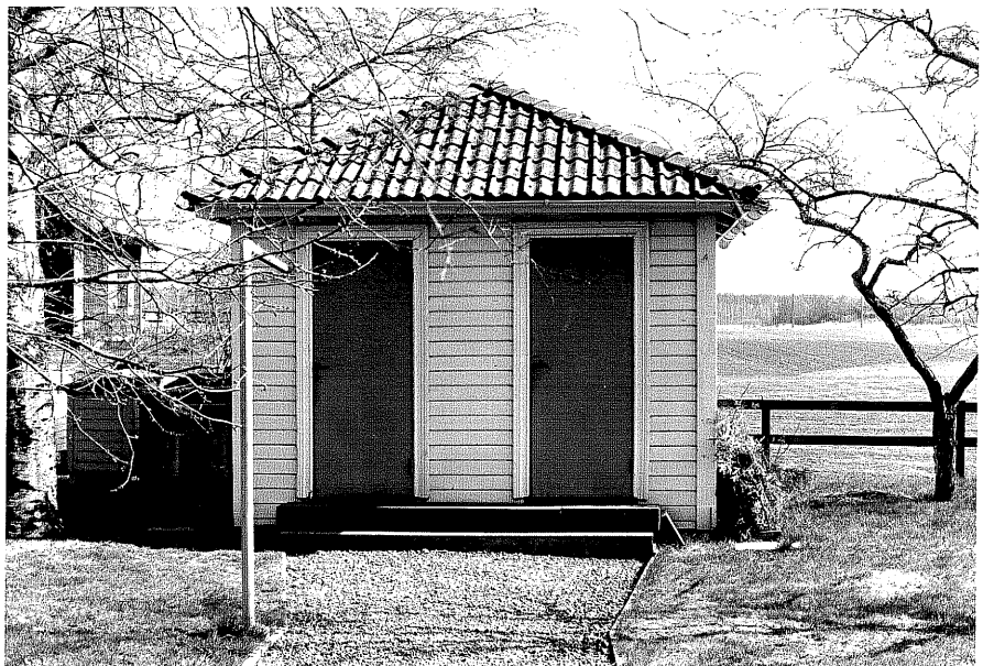
Uthas b fr.N, 12:16.