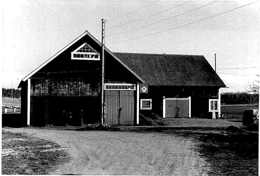
Ladugård e fr.N, 14:19.

Ödeshög sn Ödeshög Skattegård 2 4 Storgatan 1978.