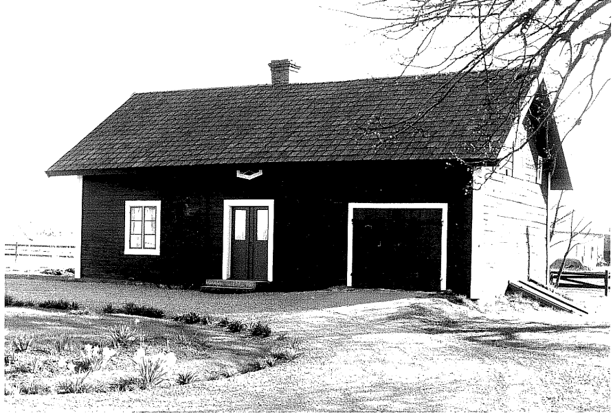
Uthus b fr.NO, 14:22.

Ödeshög sn Ödeshög Skattegård 2 4 Storgatan foto:M.Wikdahl,1978.