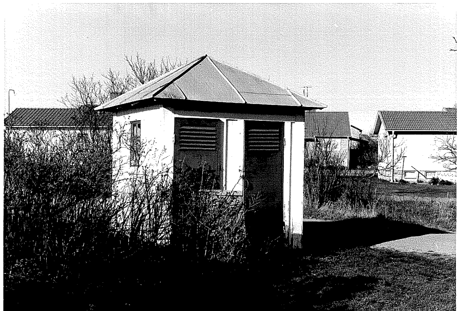
Avträde f fr.V, 14:20.