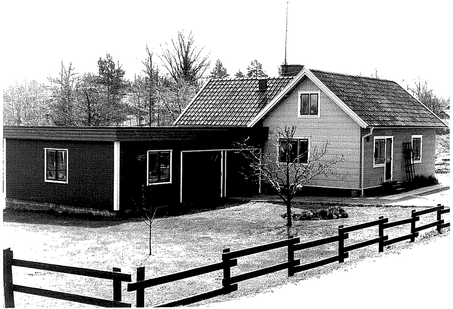
Bostadshus a fr.N, 10:26.

Ödeshög sn Ödeshög Skattegård 2 6 +2 26 Morlidsvägen1978.