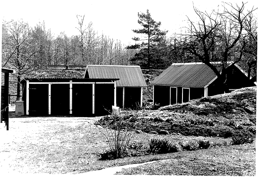
Uthus c fr.NV, 10:25.