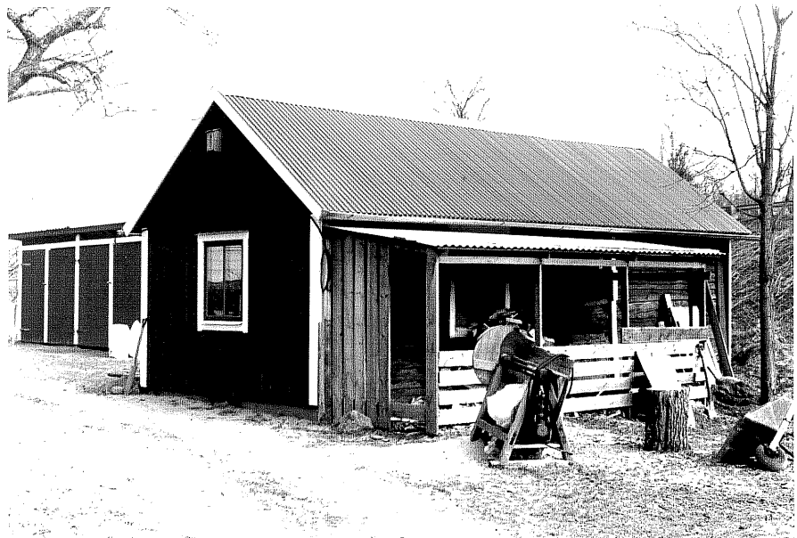
Uthus b fr.V, 10:23.