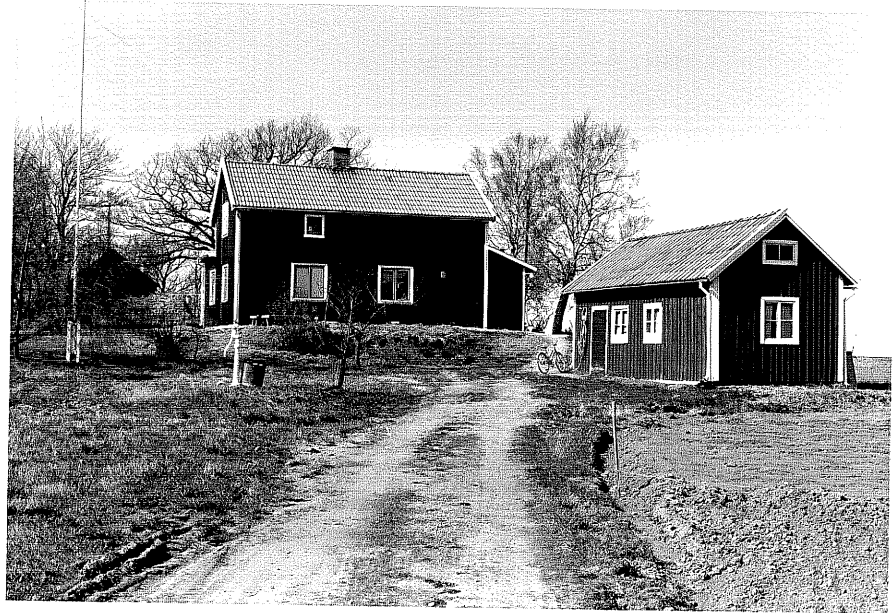
Bostadshus a och uthus b fr.S, 13:34.

Ödeshög sn Ödeshög Skrapegården 6 14 Norra Vägen foto:M.Wikdahl,1978.