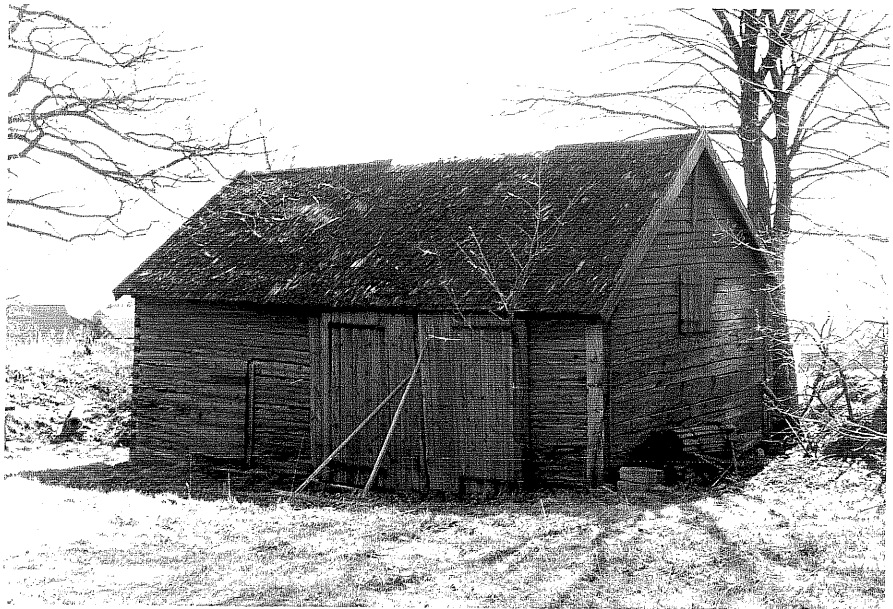
Uthus c fr.O, 13:35.