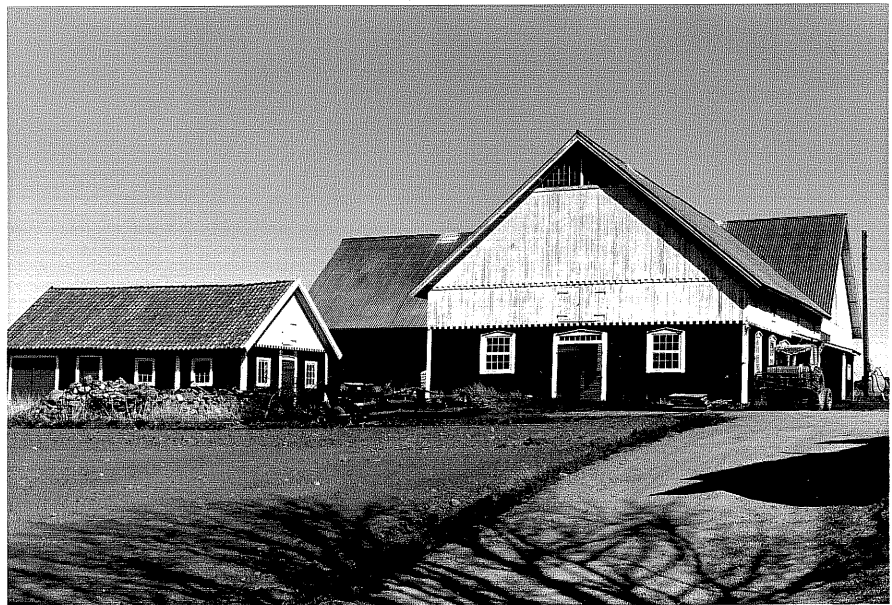
Ladugård c och uthus d fr.V, 13:32.