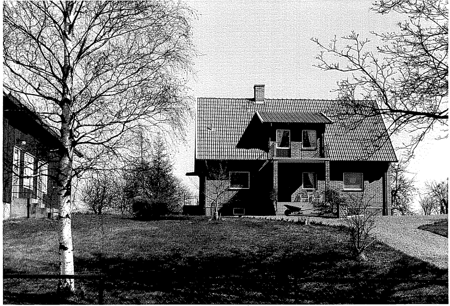
Bostadshus a fr.V, 13:33.

Ödeshög sn Ödeshög Skrapegården 6 3 mfl. Vadstenavägen foto: M. Wikdahl, 1978.