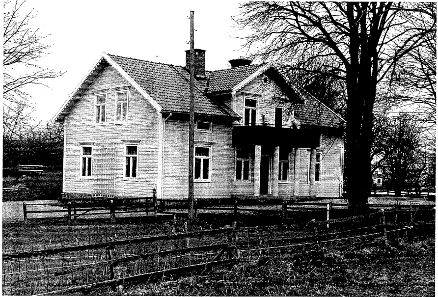
Bostadshus a fr.SÖ,15:7.

Ödeshög sn Ödeshög Södergård 8 1 Arrendatorsbostället foto:M.Wikdahl,1978.