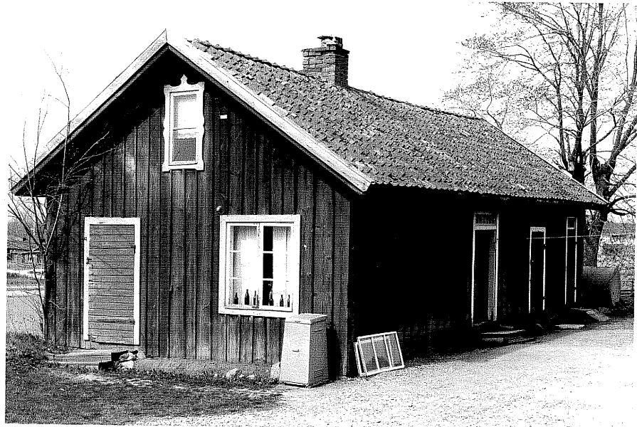
Uthus b fr.O, 15:9.

Ödeshög sn Ödeshög Söndergård 8 1 Arrendatorsbostället foto:M.Wikdahl,1978.