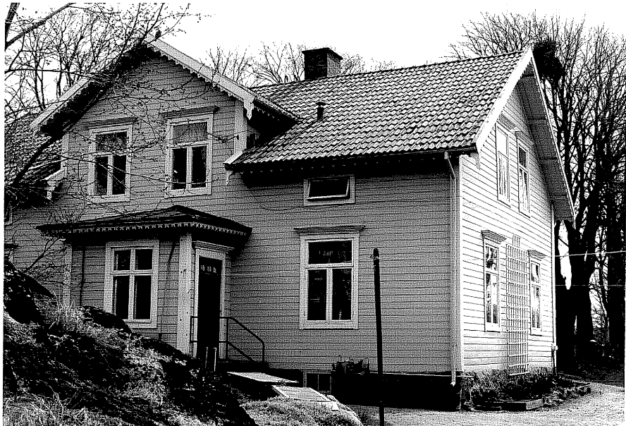
Bostadshus a fr,V, 15:8.