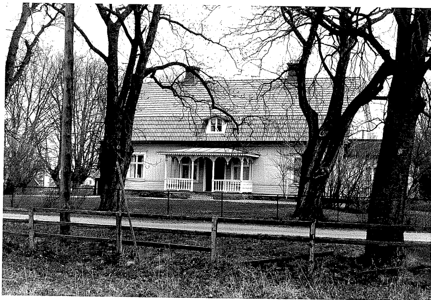
Bostadshus a fr.S, 15:6.

Ödeshög sn Ödeshög Södergård 8 1 foto:M.Wikdahl, 1978.