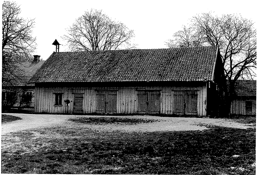
Uthus c fr.S, 15:5.

Ödeshög sn Ödeshög Södergård 8 1 foto:M.Wikdahl,1978.