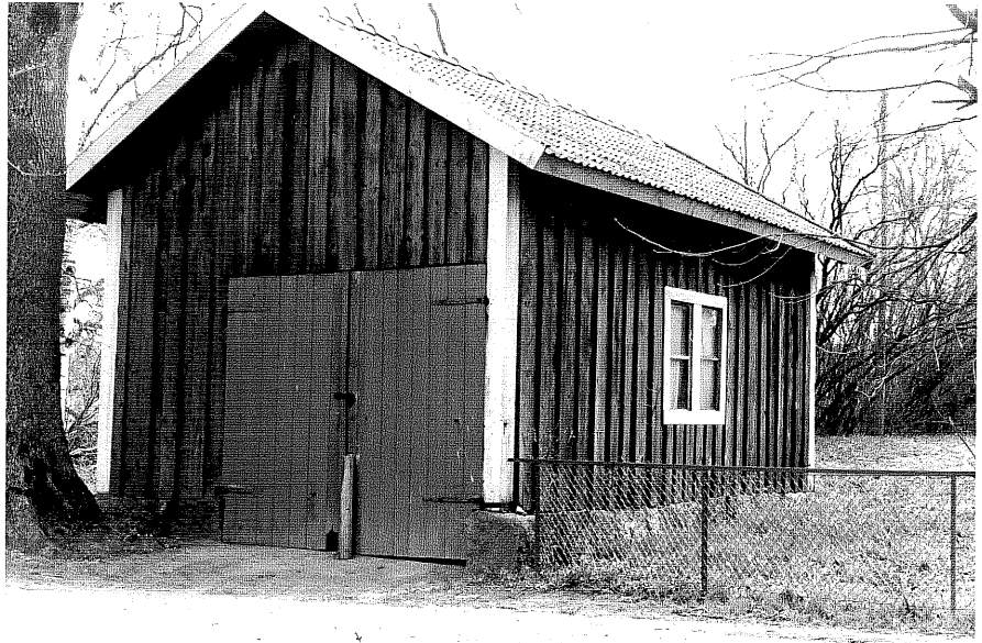
Uthus b fr.V, 15x10.

Ödeshög sn Ödeshög Södergård 8 11978