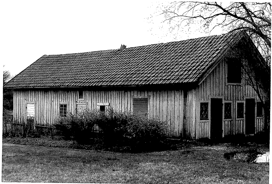
Uthus d fr.N, 15:3.