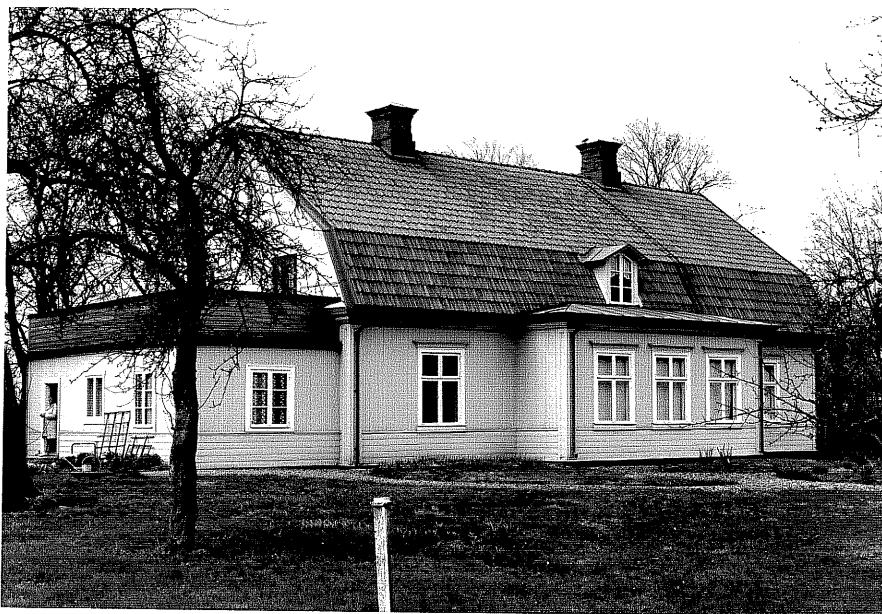
Bostadshus a fr.NO, 15:4.