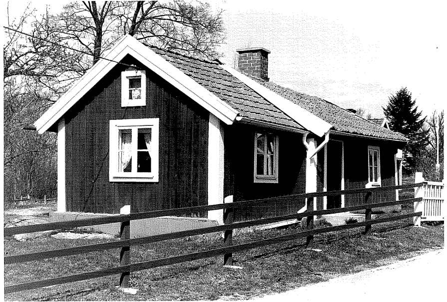
Bostadshus a fr.6, 10:29.

Ödeshög sn Ödeshög Södergård 8 10 Morlidsvägen