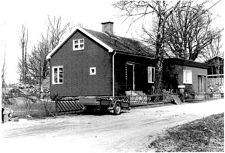
Bostadshus a fr.S, 10:24.

Ödeshög sn Ödeshög Södergård 8 5 Morlidsvägen foto:M.Wikdahl,1978.